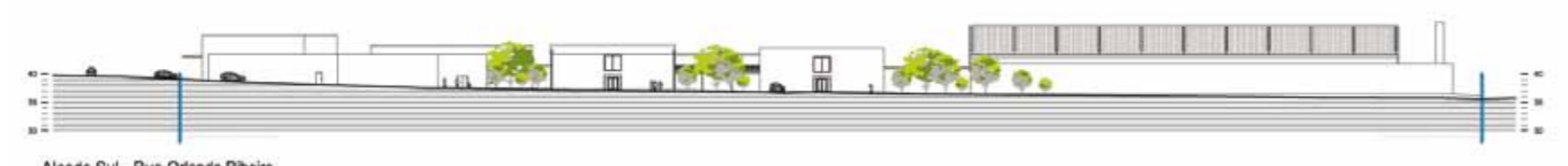
Alameda do Sul - Rua Orlando Ribeiro