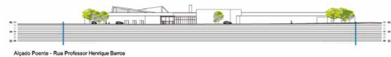
Alameda do Poente - Rua Professor Henrique Bares