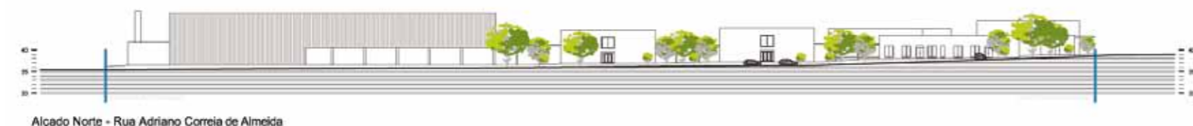
Alameda do Norte - Rua Adriano Correia de Almeida