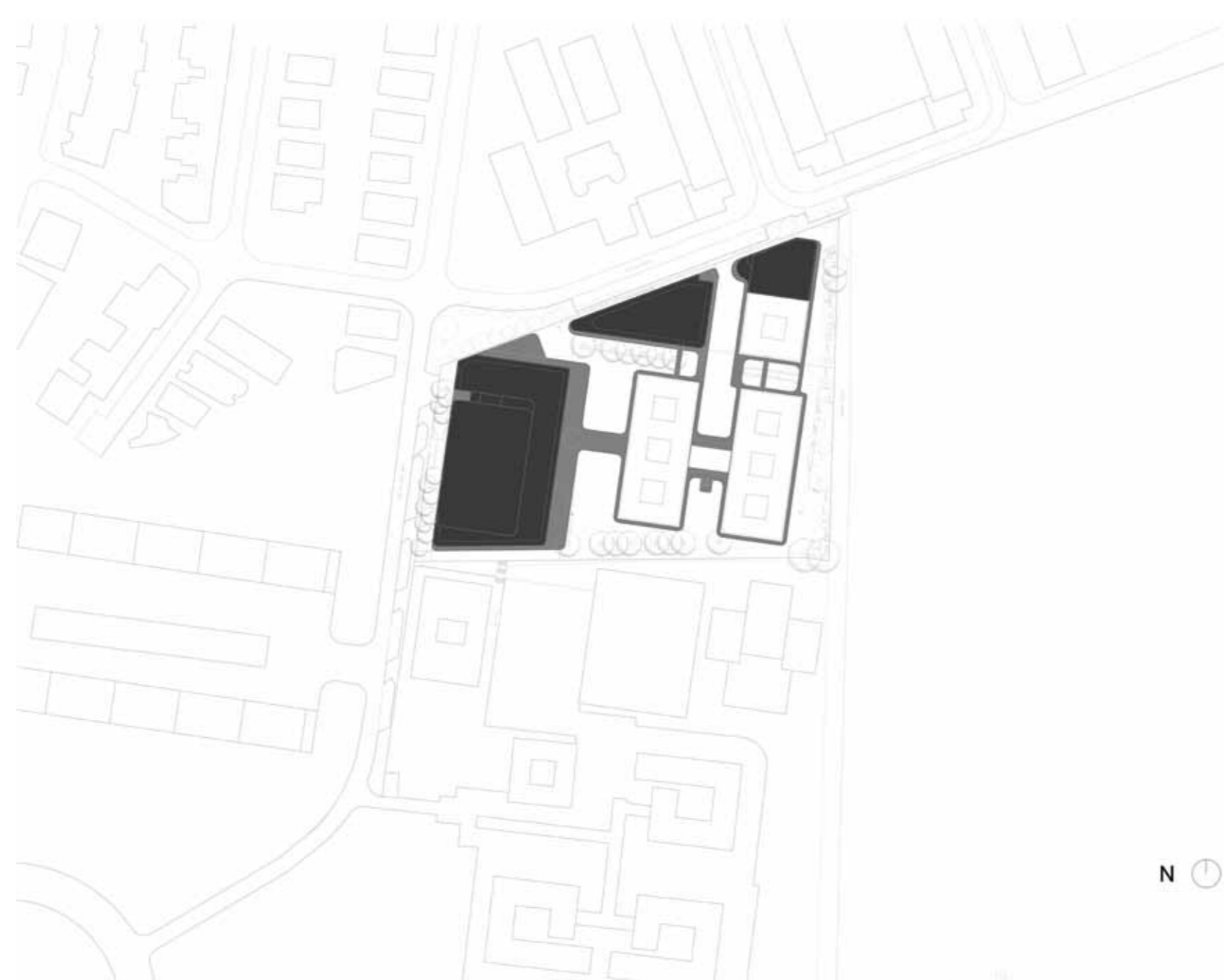
LEGENDA: PLANTA DE IMPLANTAÇÃO