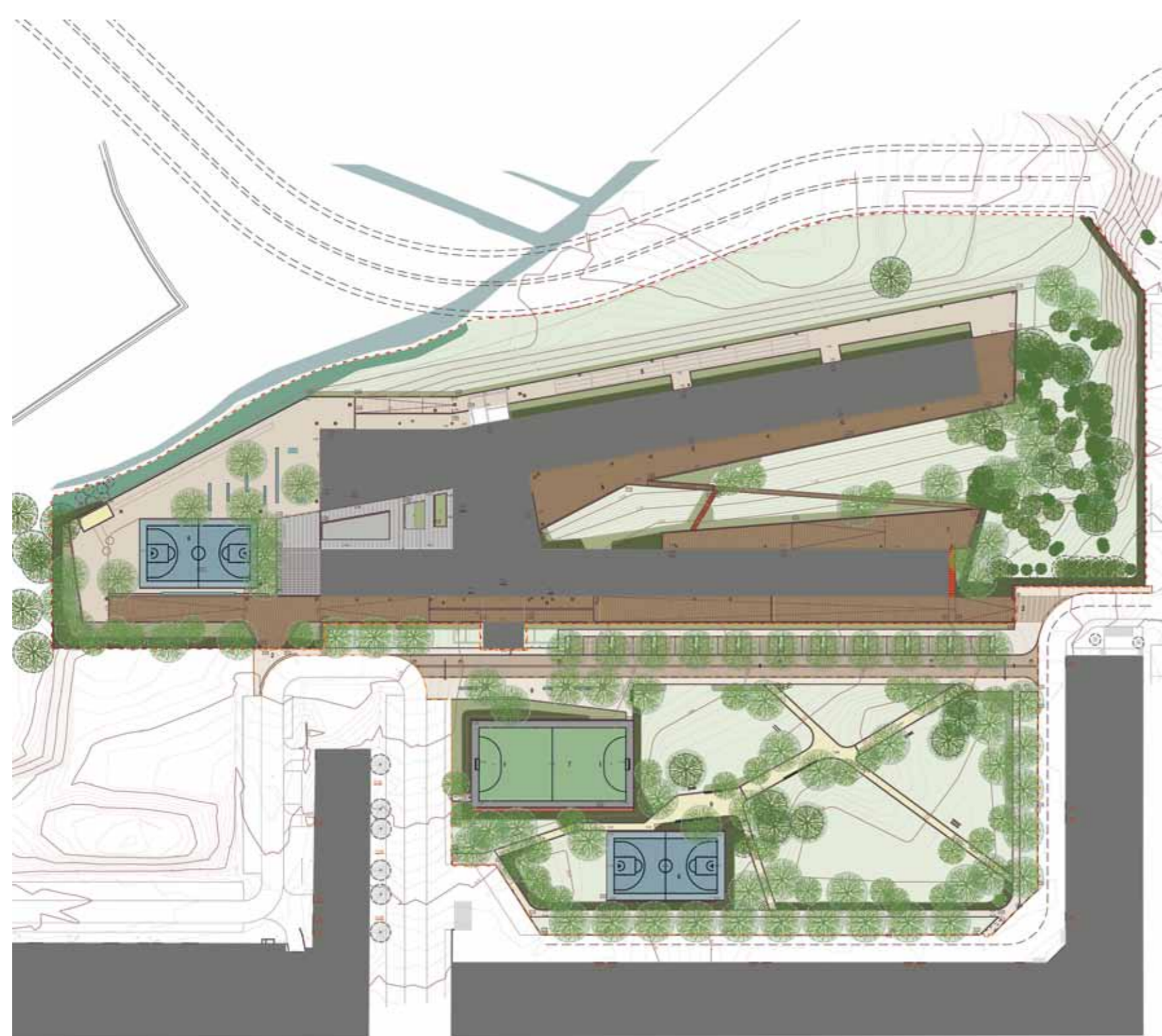
LEGENDA: PLANTA DE IMPLANTAÇÃO