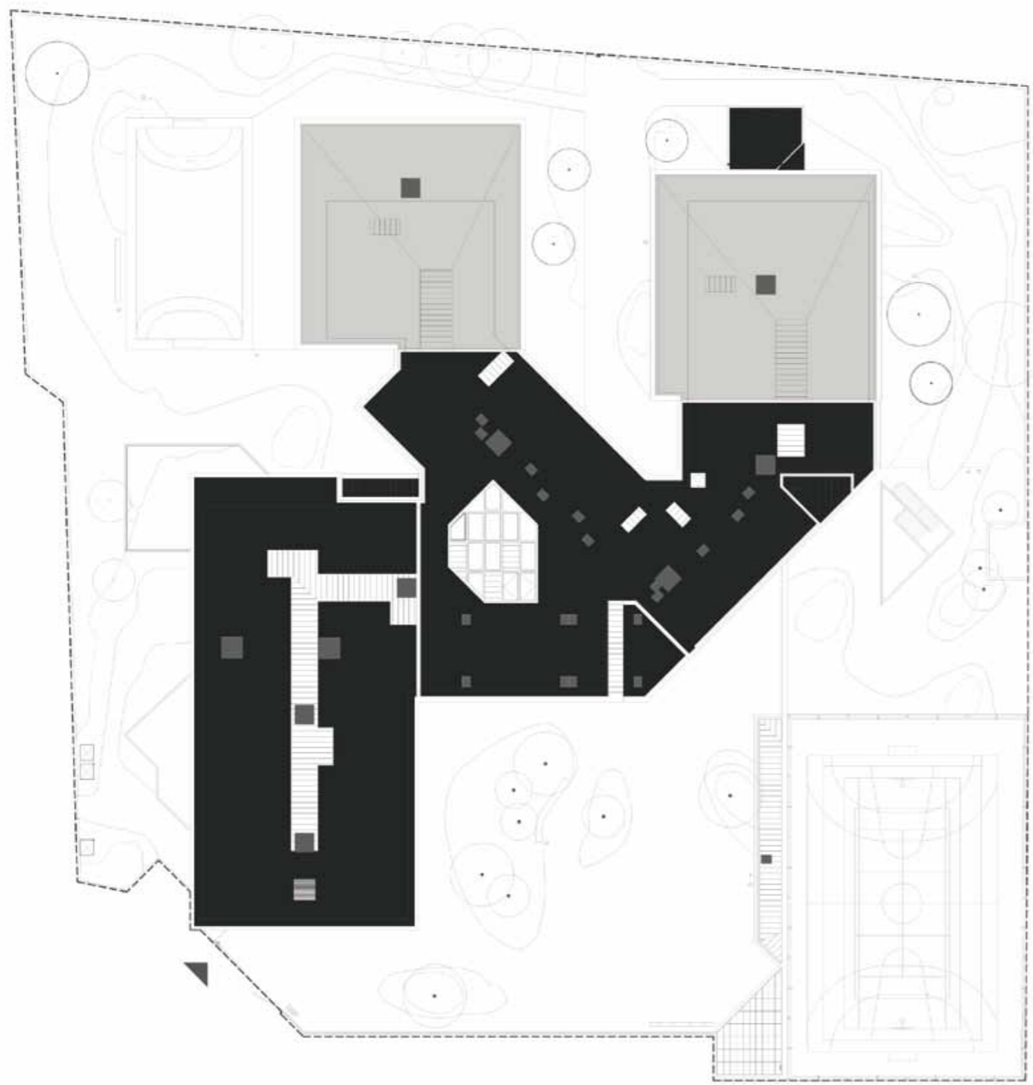
LEGENDA: PLANTA DE IMPLANTAÇÃO

■ CONSTRUÇÃO EXISTENTE ■ CONSTRUÇÃO NOVA