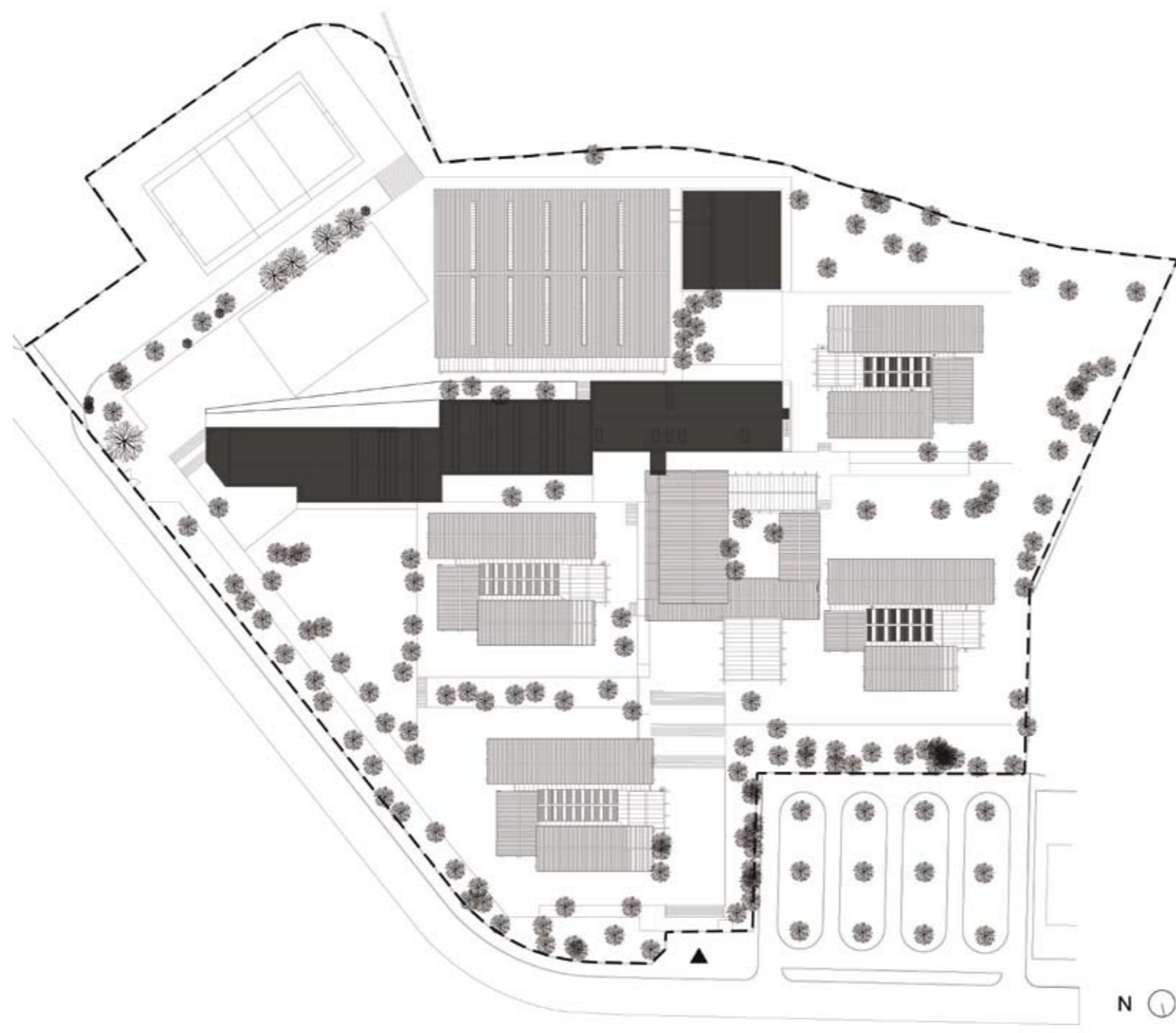
LEGENDA: PLANTA DE IMPLANTAÇÃO