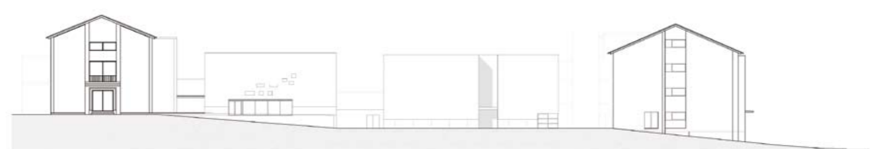
ALÇADO LATERAL (NORTE)

TIPOLOGIA DE ESCOLA: MOP | JCETS – ESCOLA INDUSTRIAL E COMERCIAL