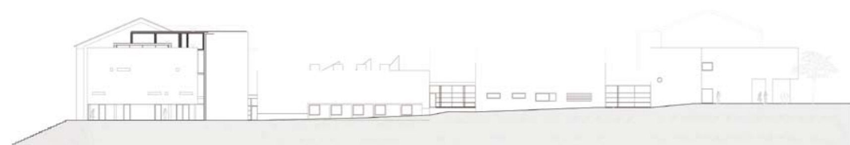
ALÇADO LATERAL (SUL)